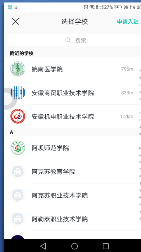
3 单击学校名称 也可搜索