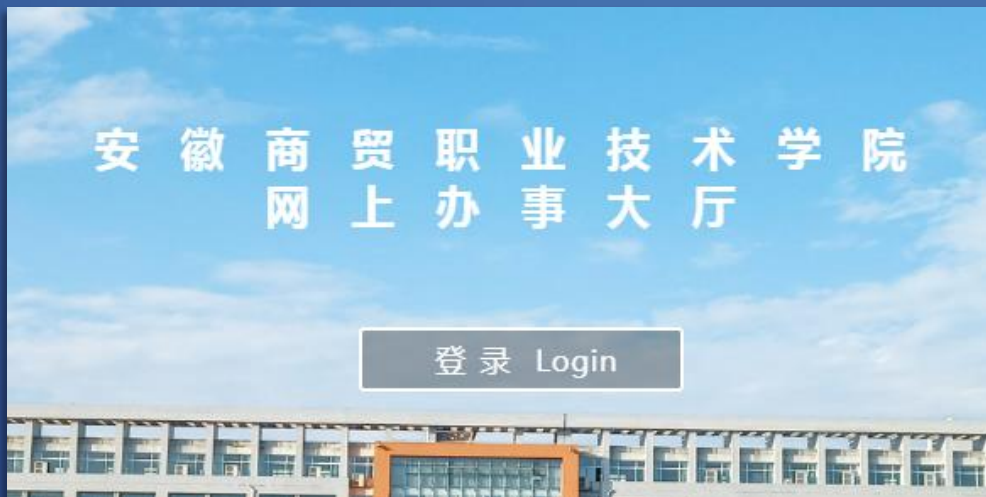
网上办事大厅（电脑端）