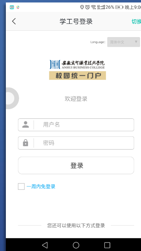
4 与电脑端 网上办事大厅 相同